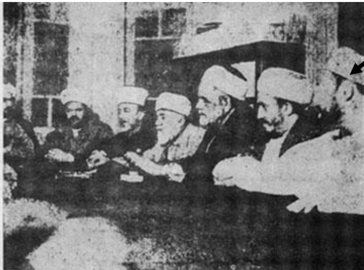
جلسه اى در محل دار التقريب در قاهره، ١٣٢٥ هـ. ق از راست به چپ:

١ - شيخ العنانى ٢ - شيخ على الخيف استاد فقه و اصول در الازهر ٣ - احمد على علويه ٤ - شيخ السكى ٥ - محمد على علويه باشا ٦ - شيخ عبدالمجيد سليم رئيس اسبق الازهر ٧ - شيخ محمود شلتوت رئيس سابق الازهر ٨ - شيخ حسن البنا رهب اول جمعيت اخوان المسلمين ٩ - شيخ محمد مدنى رئيس دانشكده حقوق اسلامى و مدير مجله رساله الاسلام ١٠ - شيخ محمد تقى قمى