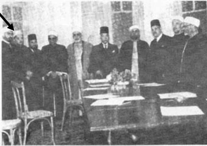
كomite مركزى تقريب بين مذاهب اسلامى، از راست به چپ:

١ - شيخ العنانى ٢ - شيخ على الخيف استاد فقه و اصول در الازهر ٣ - احمد على علويه ٤ - شيخ السكى ٥ - محمد على علويه باشا ٦ - شيخ عبدالمجيد سليم رئيس اسبق الازهر ٧ - شيخ محمود شلتوت رئيس سابق الازهر ٨ - شيخ حسن البنا رهب اول جمعيت اخوان المسلمين ٩ - شيخ محمد مدنى رئيس دانشكده حقوق اسلامى و مدير مجله رساله الاسلام ١٠ - شيخ محمد تقى قمى